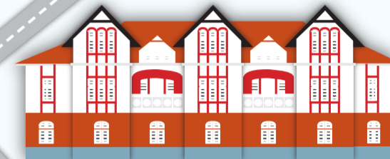
Casa do Comércio