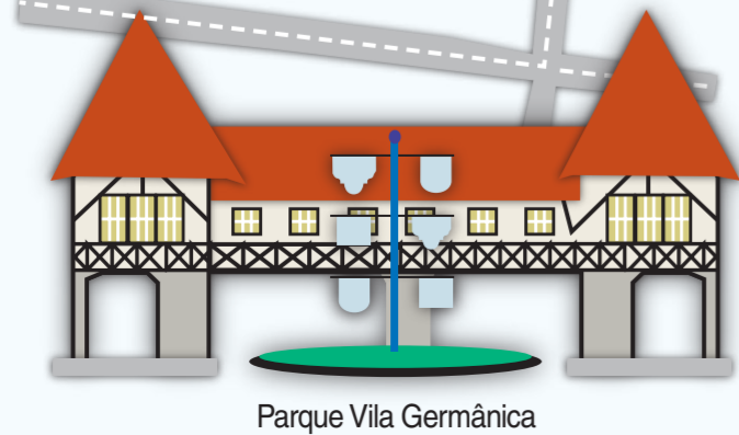
Parque Vila Germânica

Horário de largada: 17h50min de sexta-feira