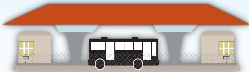
Terminal da Proeb